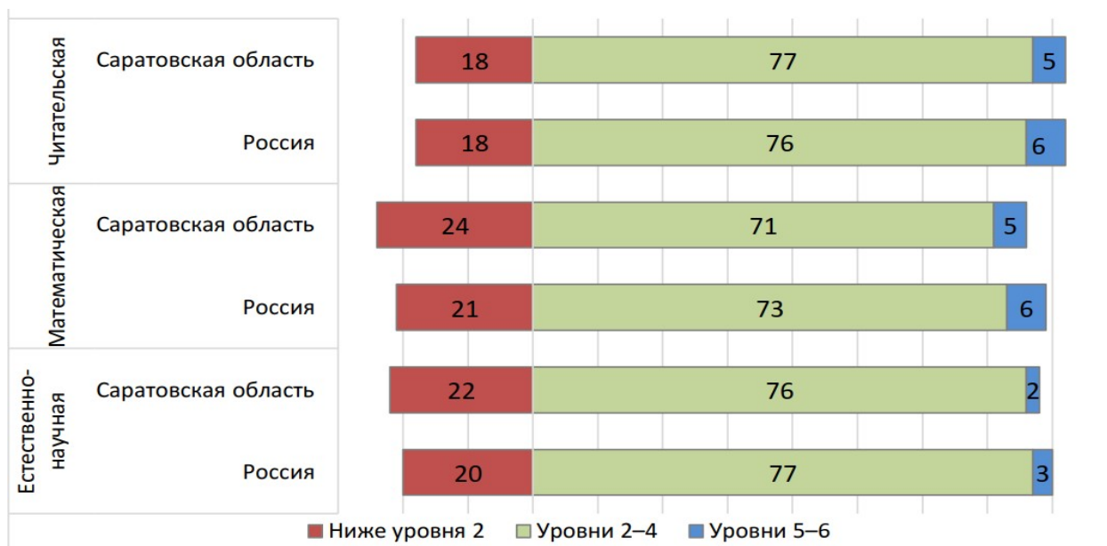
Рис.2. Распределение учащихся по уровням грамотности

Результаты анализа, представленные в таблице 5, показывают наличие некоторого образовательного неравенства. В развитии естественнонаучной грамотности оно проявляется в меньшей степени, чем в случае математической и читательской грамотности.